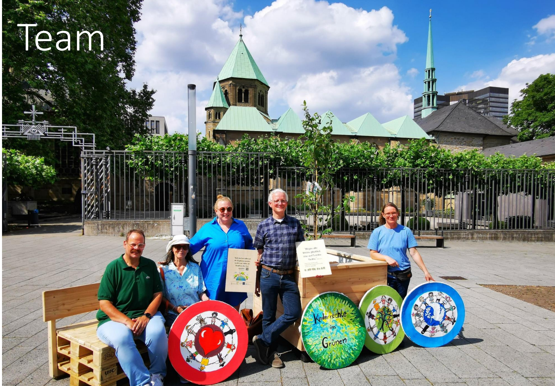
Garten der Kinderrechte – Burgplatz Essen