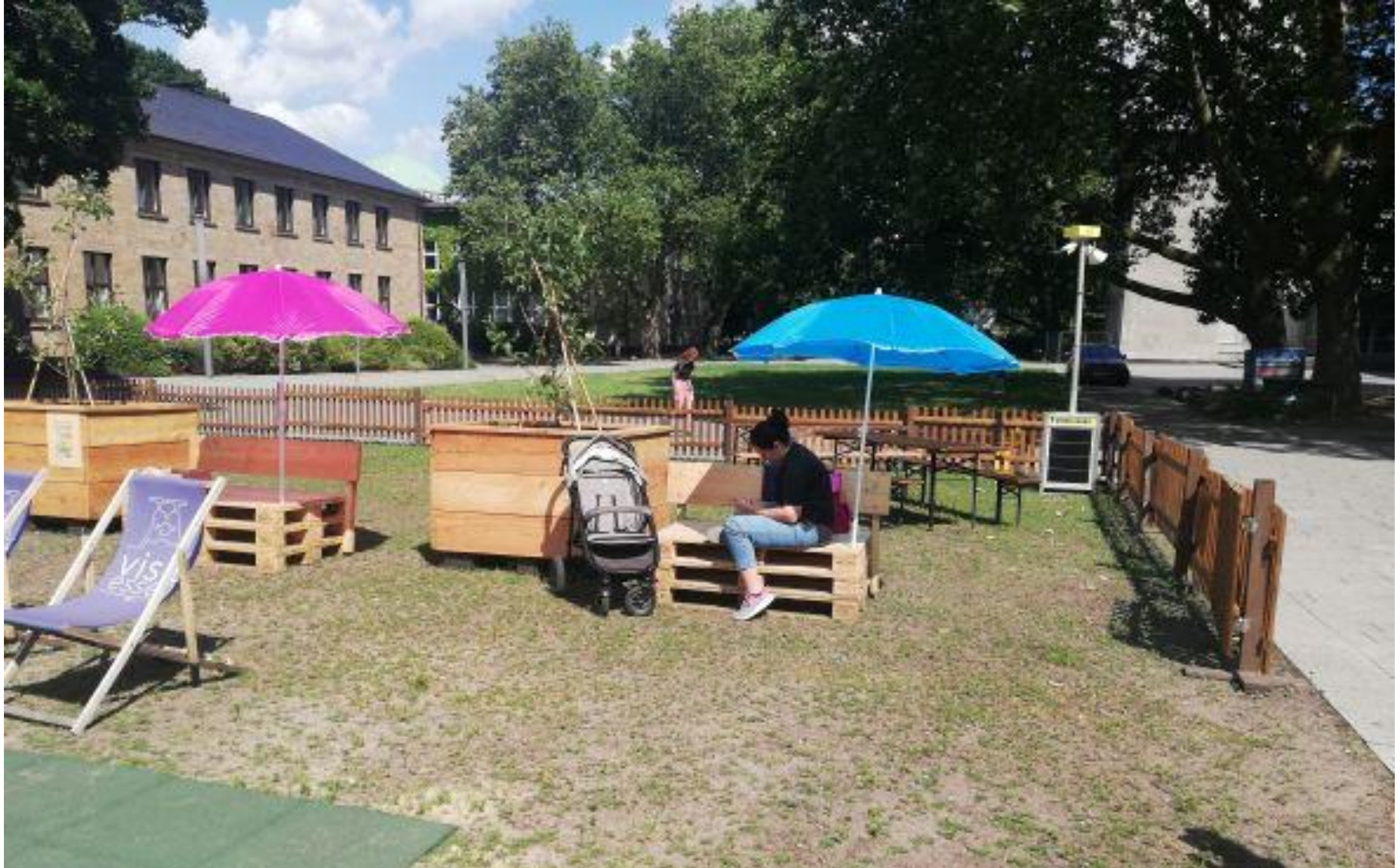
Garten der Kinderrechte – Burgplatz Essen