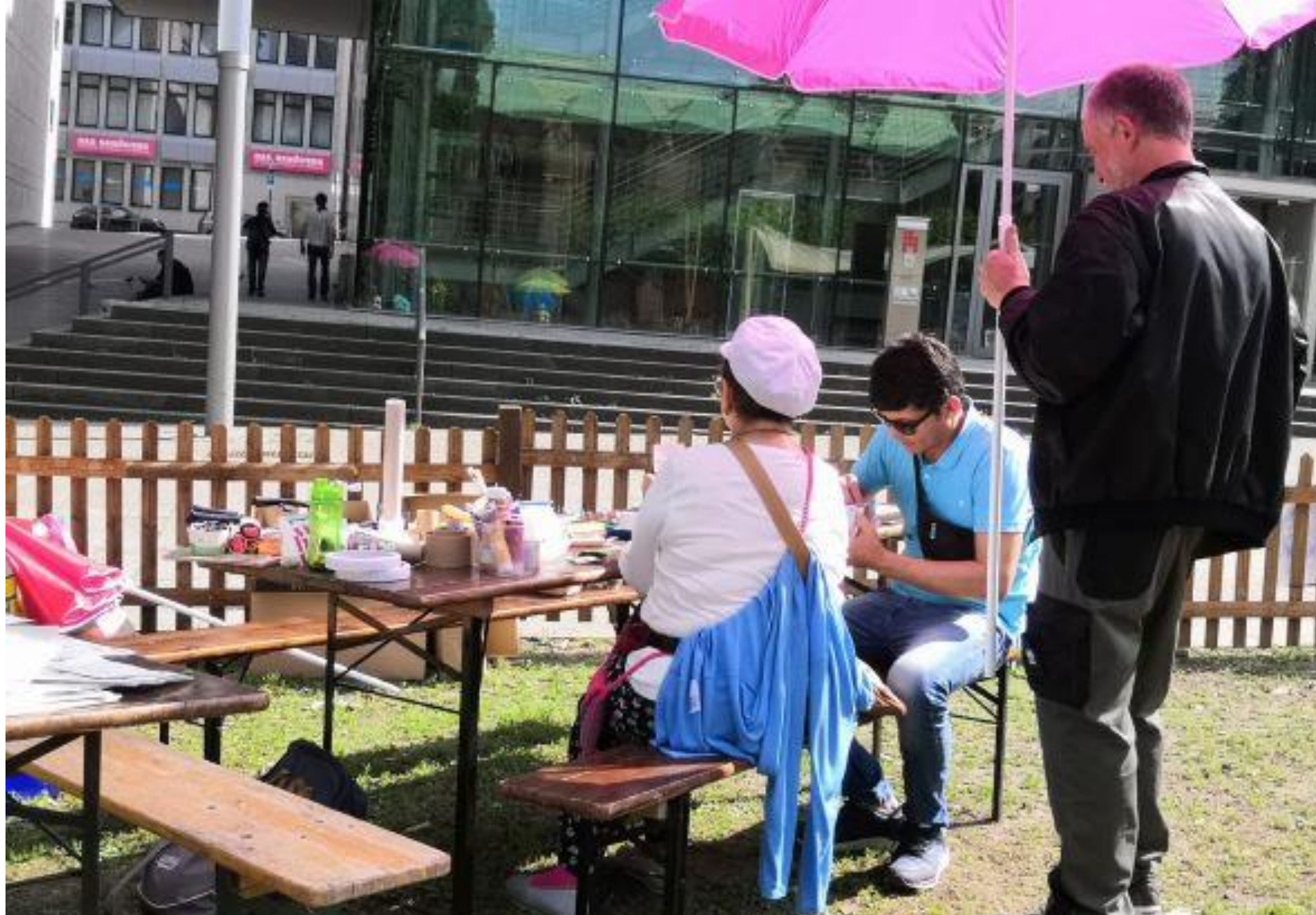
Garten der Kinderrechte – Burgplatz Essen