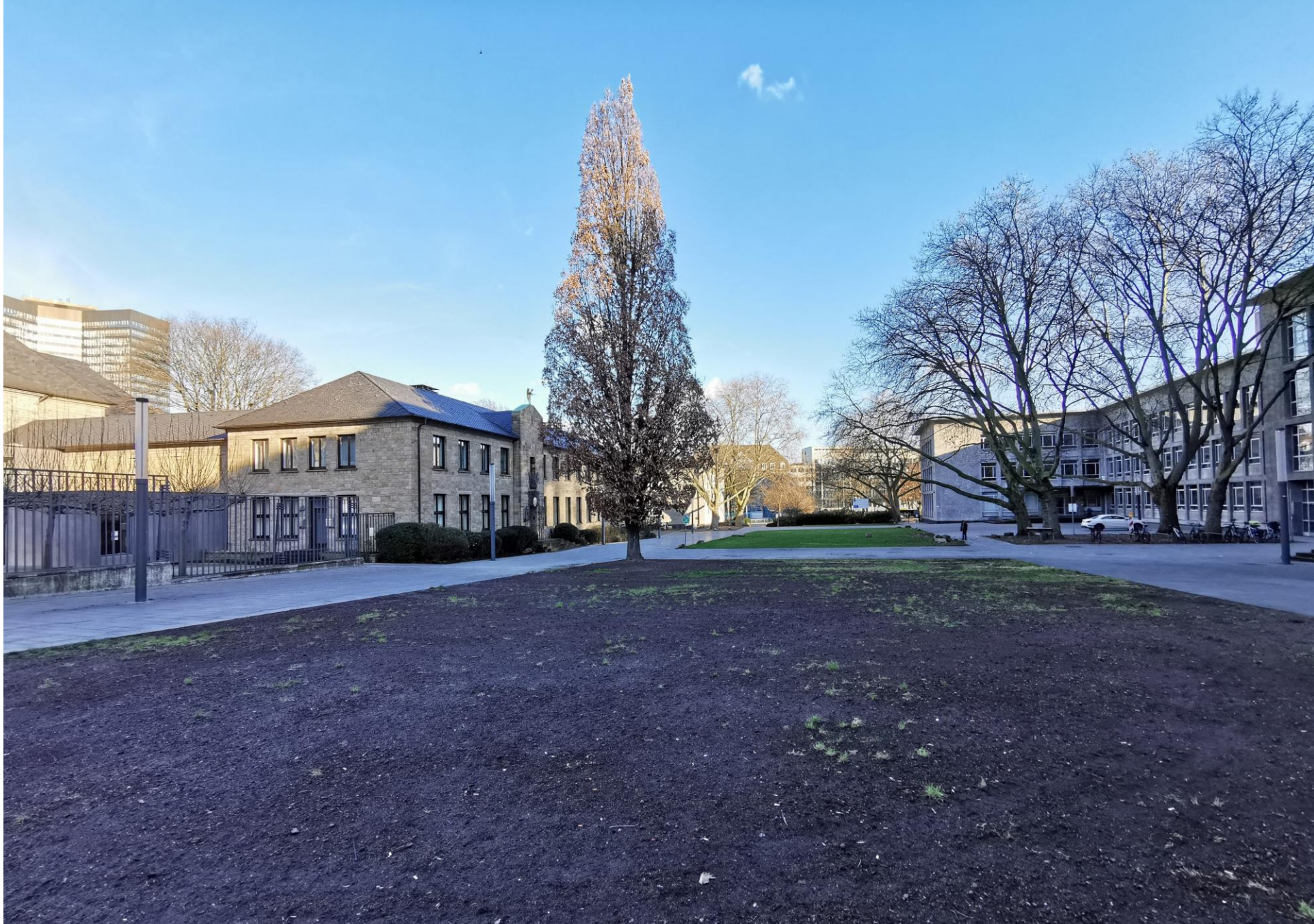
Garten der Kinderrechte – Burgplatz Essen