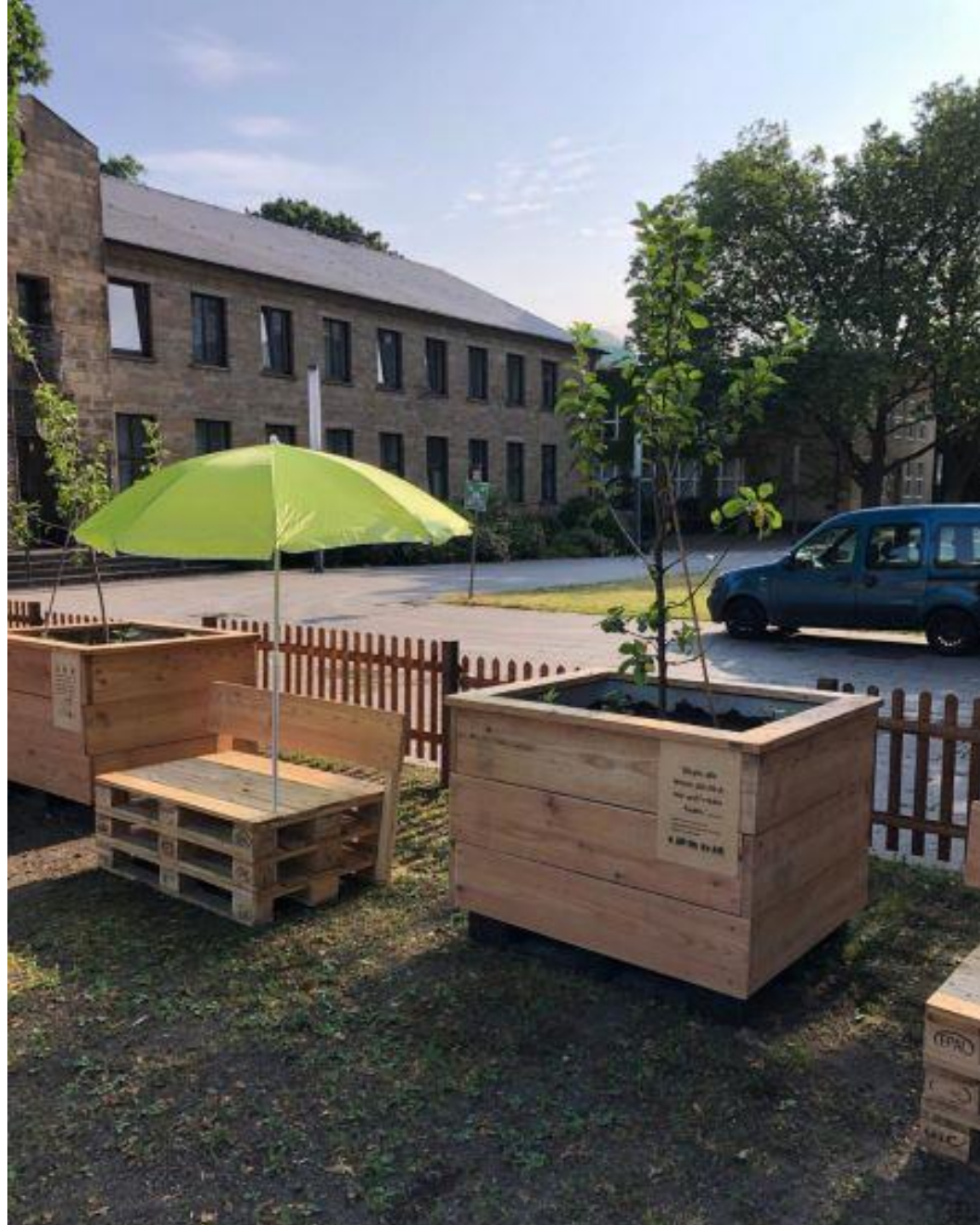
Garten der Kinderrechte – Burgplatz Essen