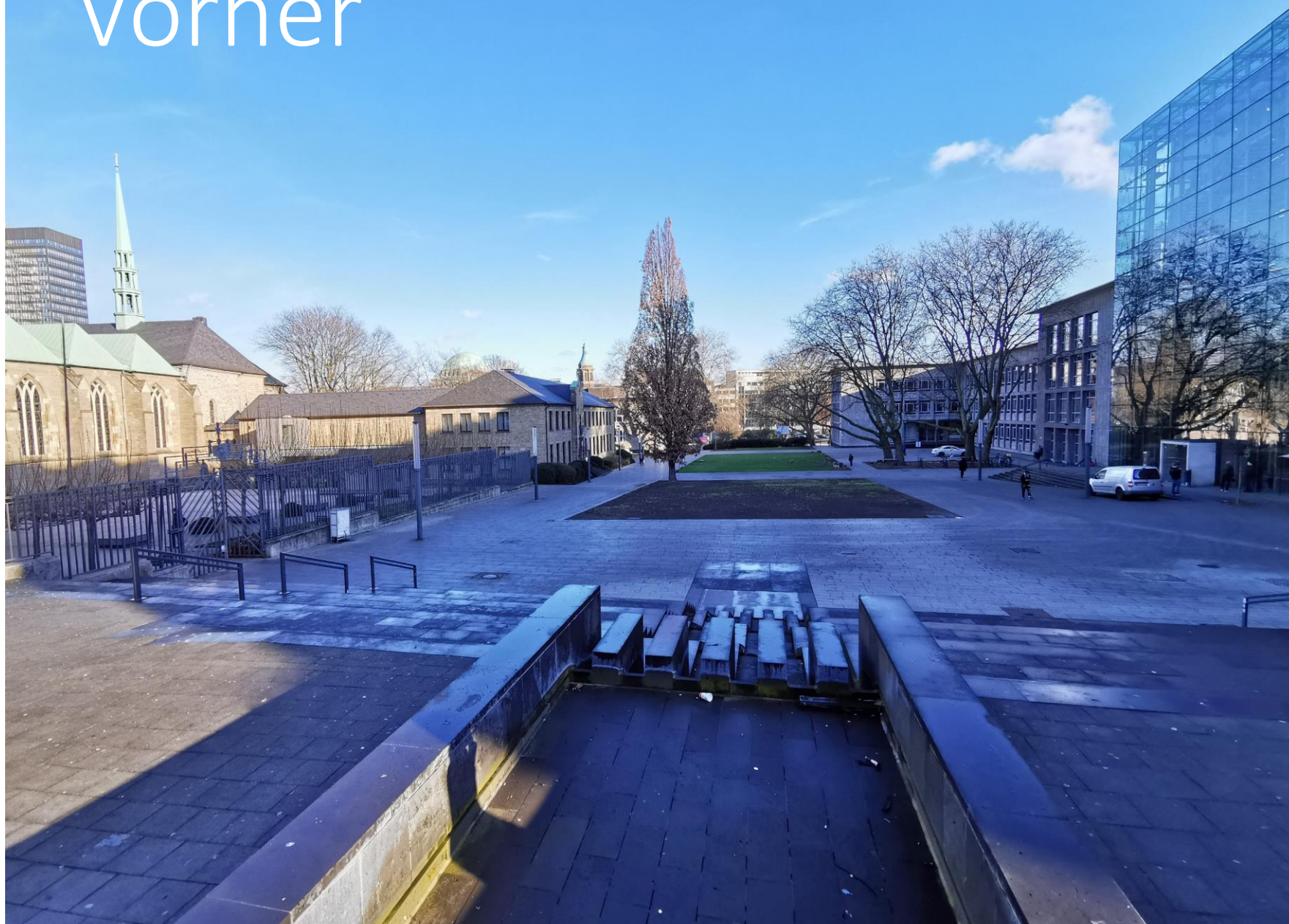
Garten der Kinderrechte – Burgplatz Essen