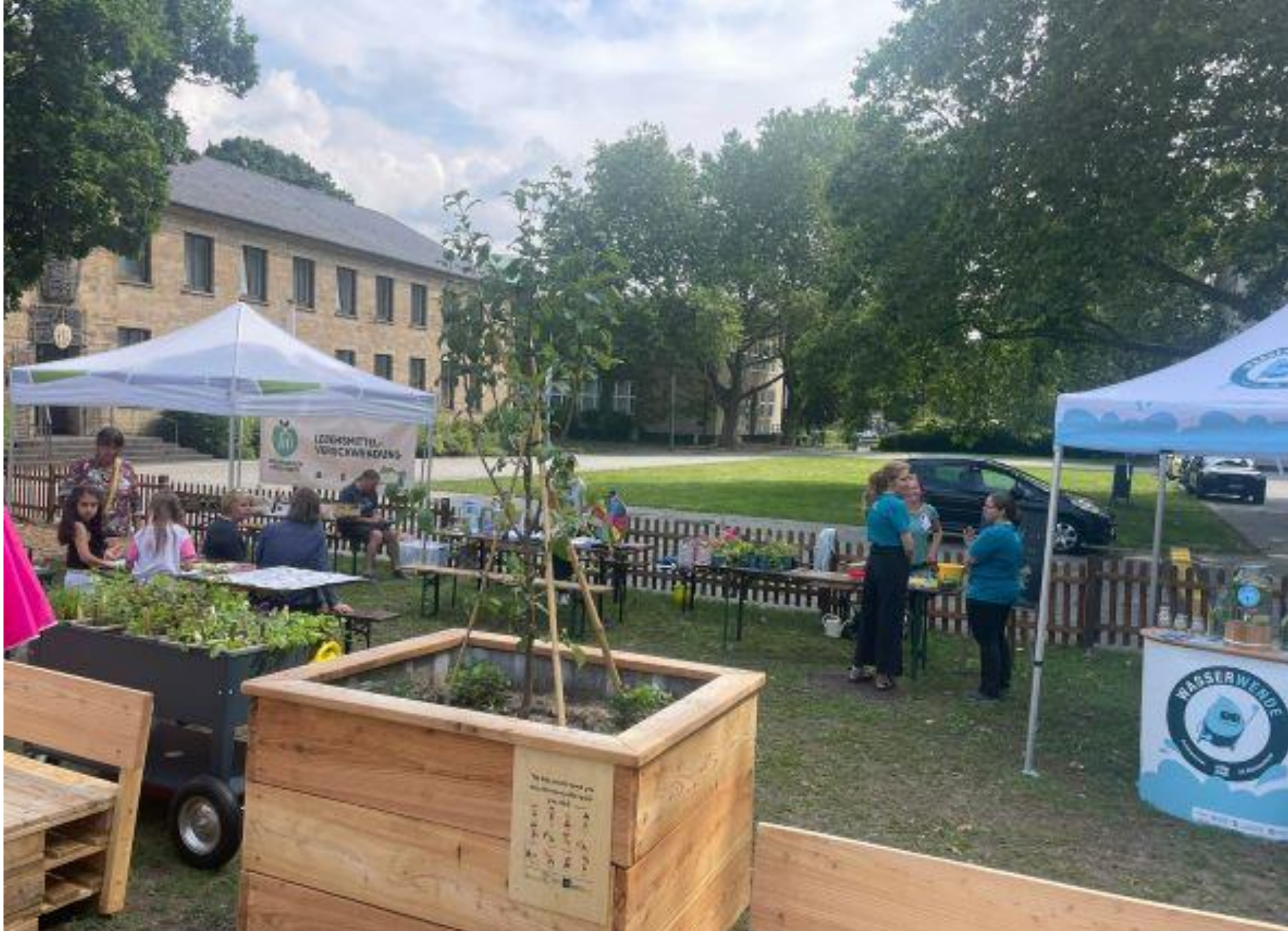
Garten der Kinderrechte – Burgplatz Essen