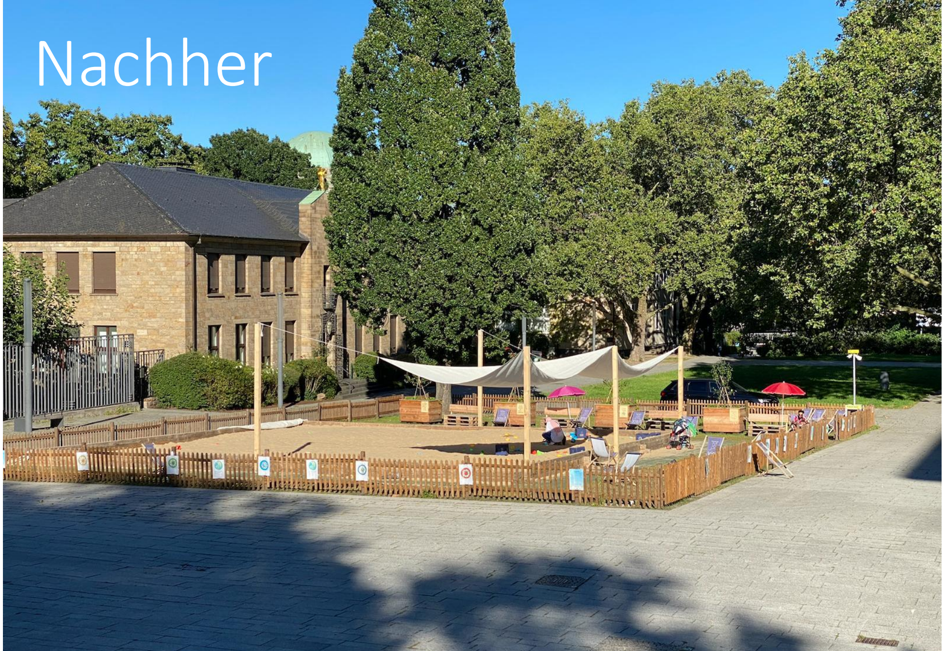
Garten der Kinderrechte – Burgplatz Essen