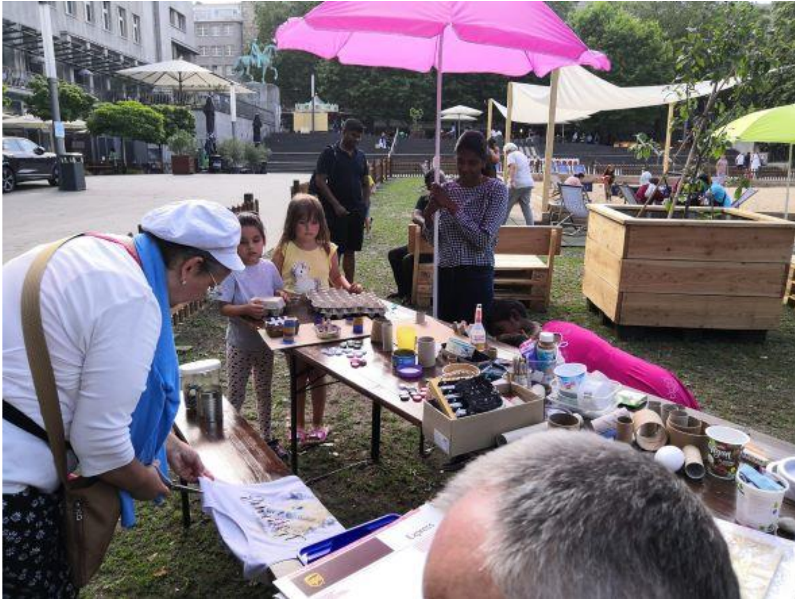
Garten der Kinderrechte – Burgplatz Essen