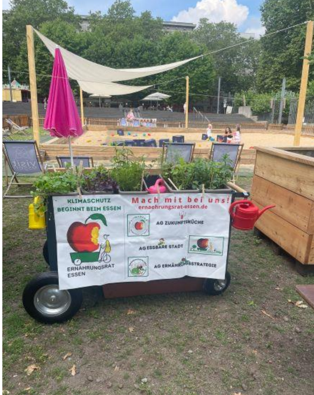
Garten der Kinderrechte – Burgplatz Essen