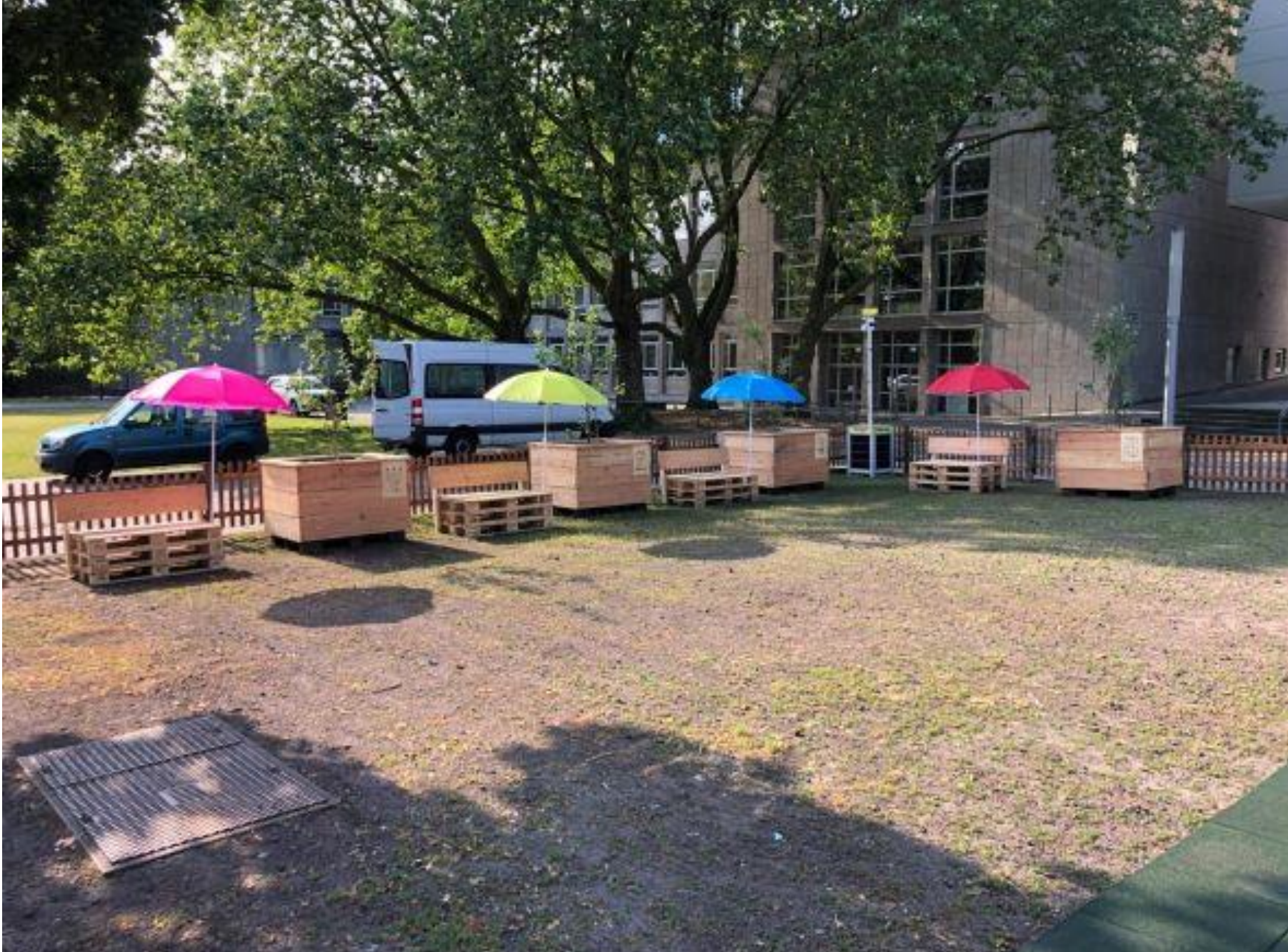
Garten der Kinderrechte – Burgplatz Essen