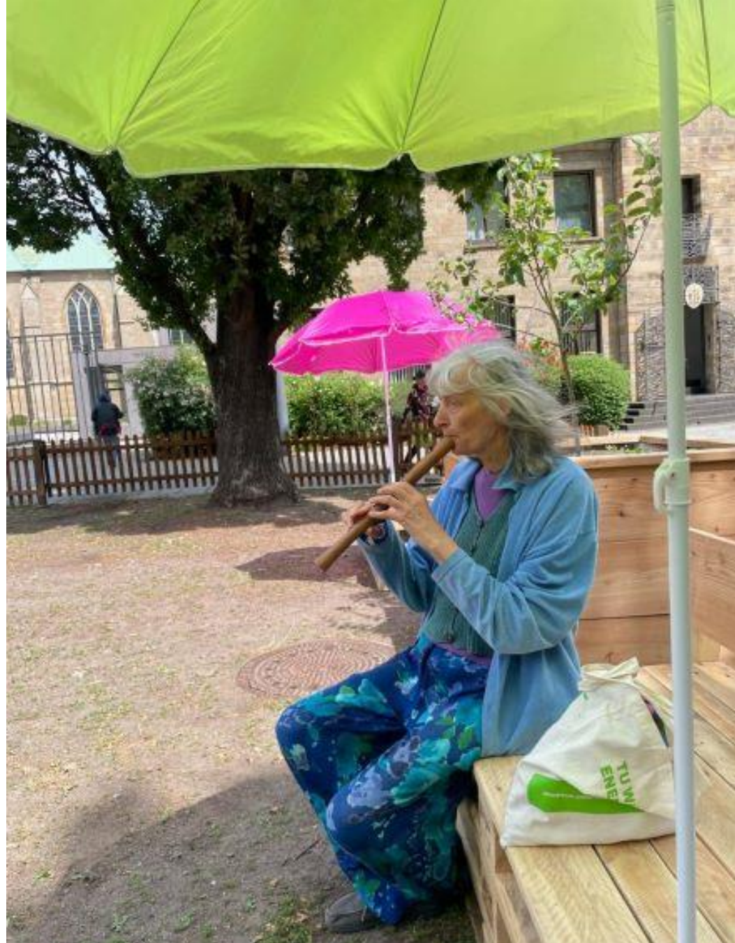
Garten der Kinderrechte – Burgplatz Essen