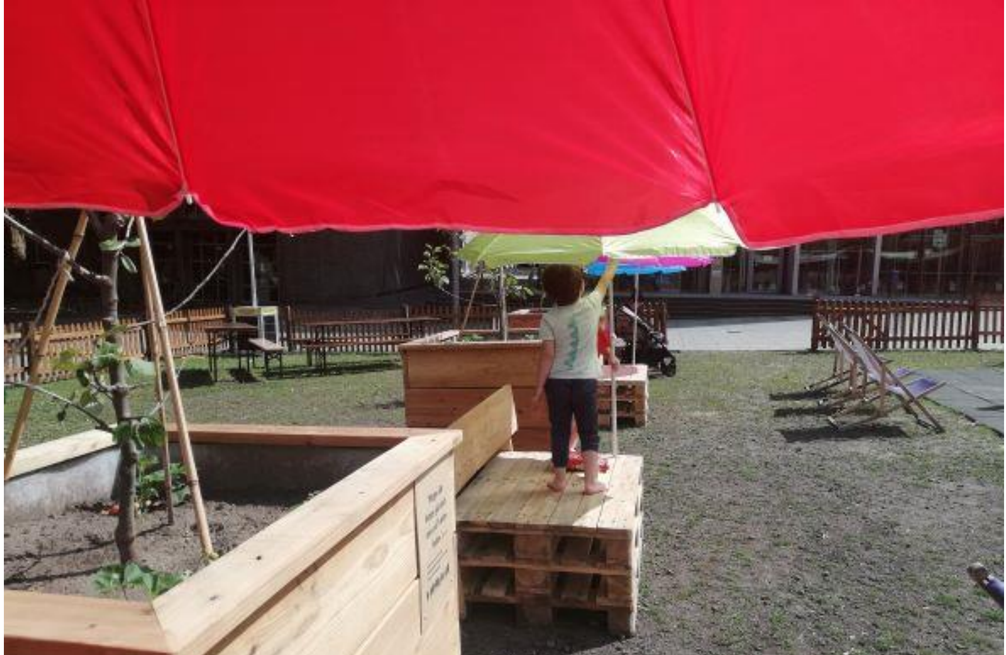
Garten der Kinderrechte – Burgplatz Essen